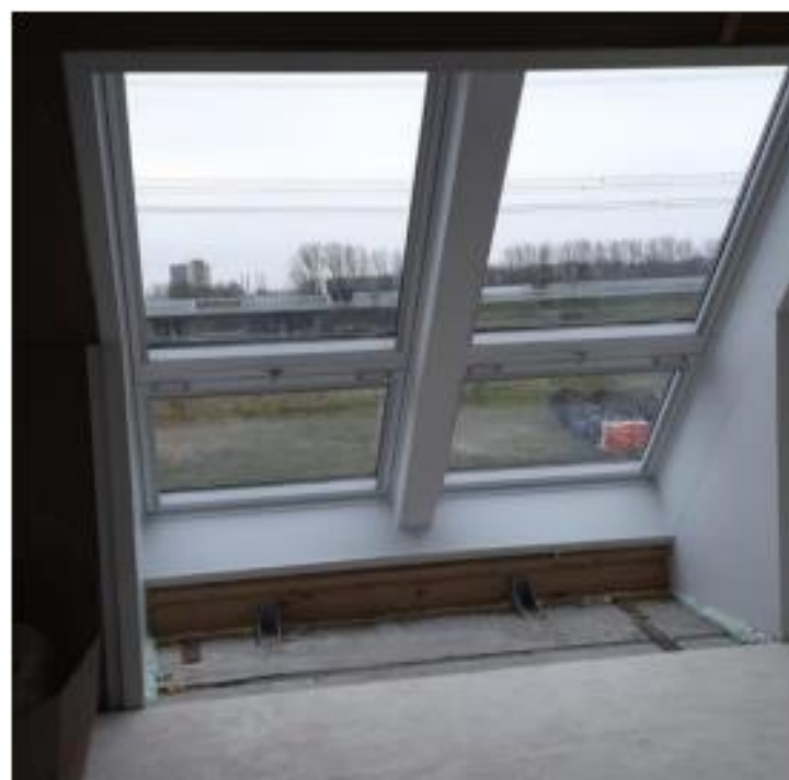
Cabrio duo van binnenuit Balkonvenster