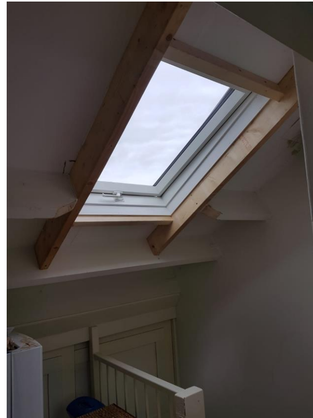
Los dakraam, gordingen doorgehaald en opgevangen