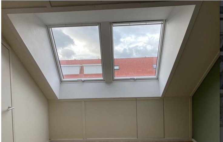
Duo standaard dakkapel