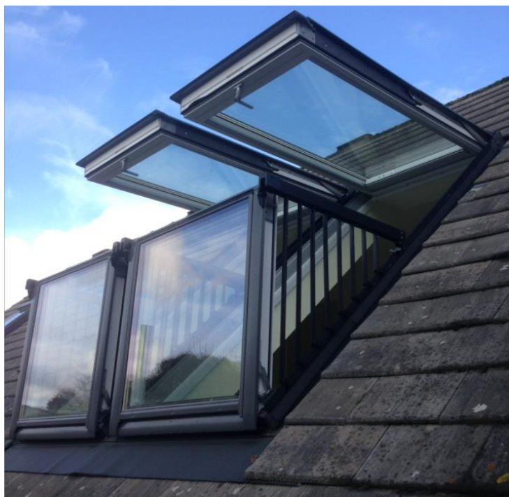
Cabrio duo Balkonvenster