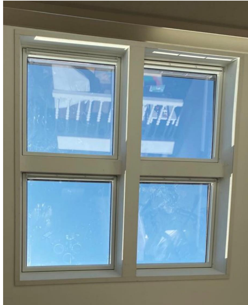
Quattro gekoppelde dakramen