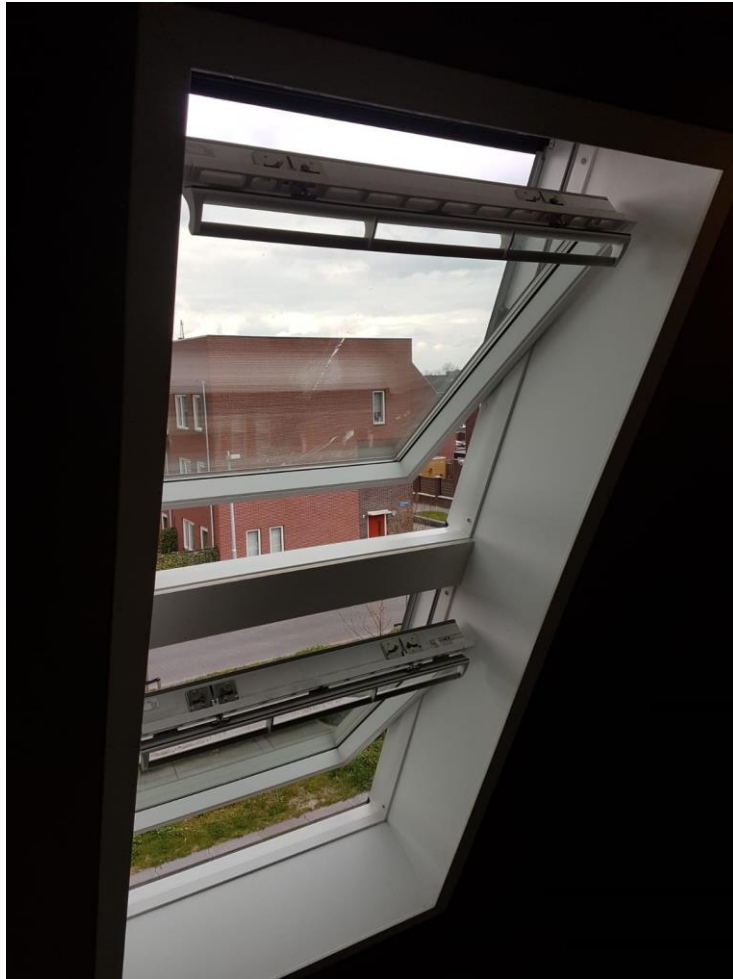
2 verticaal gekoppelde dakramen