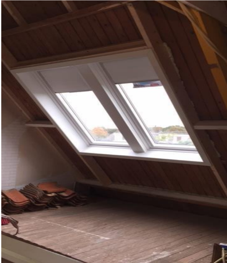
2 gekoppelde dakramen, haakse aftimmering