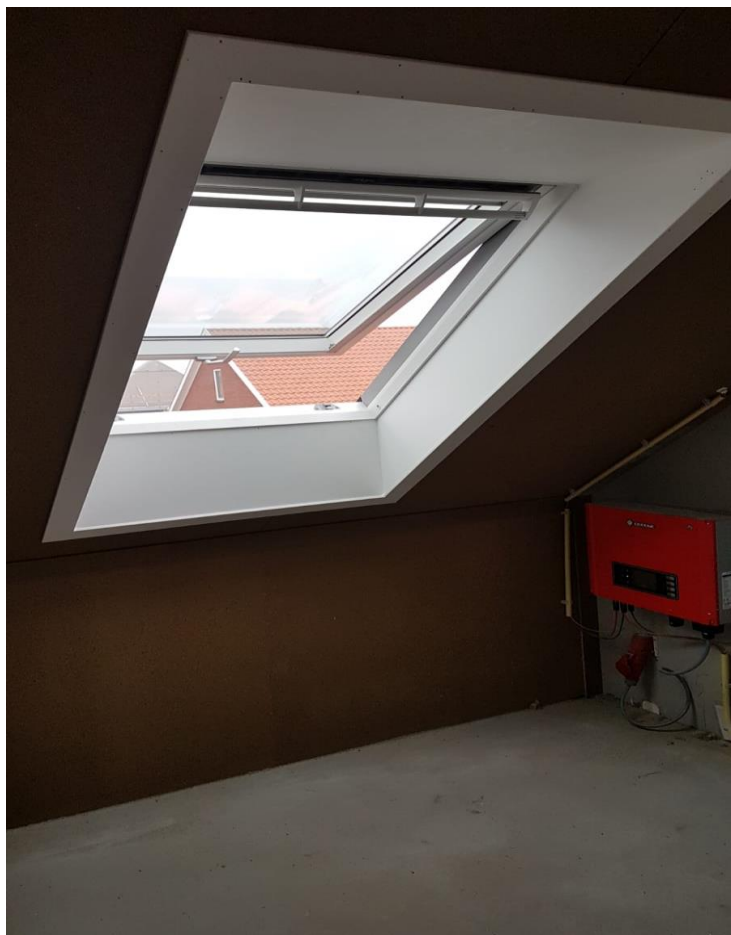
Los uitzet-tuimeldakraam, boven en onder schuin afgetimmerd