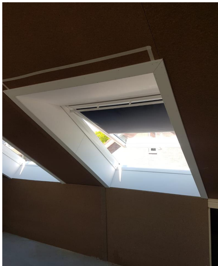
Los uitzet-tuimeldakraam, boven schuin, onder haaks afgetimmerd