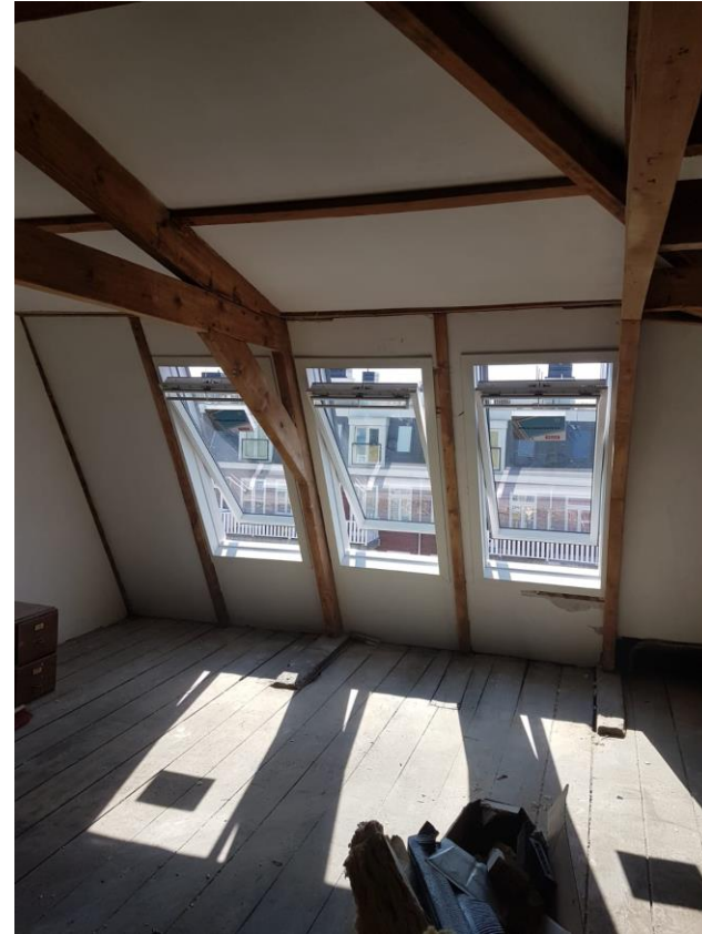
3 gekoppelde dakramen