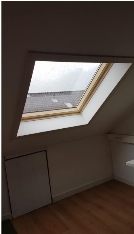
Los dakraam, haaks afgetimmerd

Foto's van door ons geplaatste dakramen, daglichtsystemen en vergunningsvrije dakkapellen.